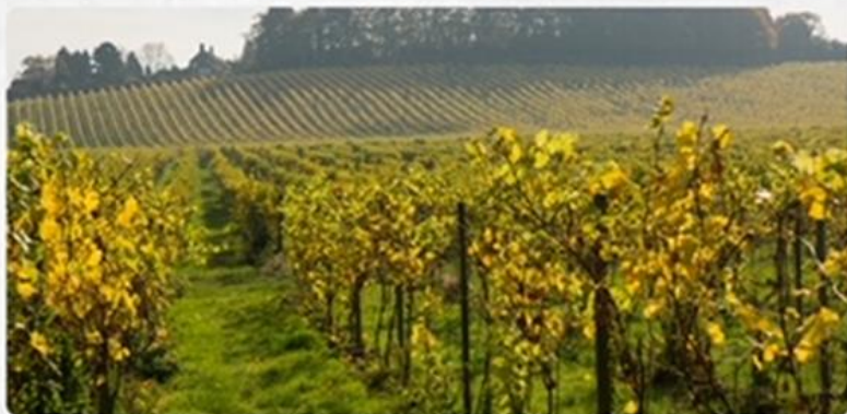
An English vineyard.